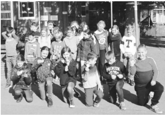
Kinder der 4a und 4b nach der Siegerehrung

Am Mittwoch, den 30.09.2020 war es soweit: Die Kinder des vierten Jahrgangs der Grundschule Eldingen traten beim ADAC-Fahrradturnier an. Nachdem zuvor der Parcours über zwei Wochen lang trainiert worden war, gab es jetzt die Chance, sich im Wettkampf der Klassen zu messen. Dabei ging es neben der Geschicklichkeit auch um das Einhalten wichtiger Verkehrsregeln, so z.B. beim Wechseln der Spur. Das Umgucken hatten alle gut automatisiert und brachten es in der Prüfung gezielt an. Aber auch der Faktor Zeit spielte bei der Bewältigung der Prüfstrecke eine wichtige Rolle. Am Ende der gesamten Prüfung gab es jeweils aufgeteilt nach Jungen und Mädchen je einen Gold-, Silber- und Bronzegewinner. Alle anderen bekamen eine Anerkennungsurkunde für die Teilnahme an der Prüfung. Allen Beteiligten an der Fahrradprüfung sei hiermit gedankt.