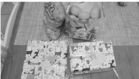
Noch ein Geschenk von einem Wichtel