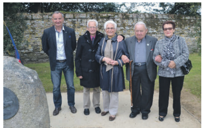
2015 in Bricquebec