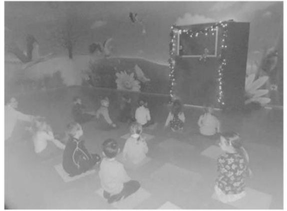
Die Auszubildenden bereiten ein Kaspertheaterstück für jede Gruppe vor, das sie allen zeigten.