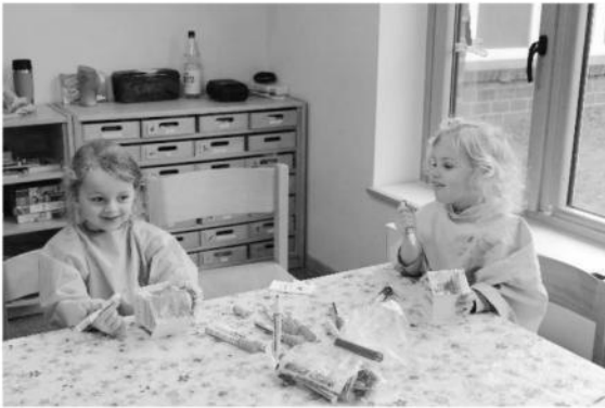
Die Schmetterlingswichtel bei der Arbeit

So verwandelten sich Mäuse-, Käfer-, Frosch-, und Schmetterlingsgruppe in fleißige Wichtelwerkstätten. Anschließend konnte sich jede Gruppe über eine kleine Überraschung in der Adventszeit freuen.