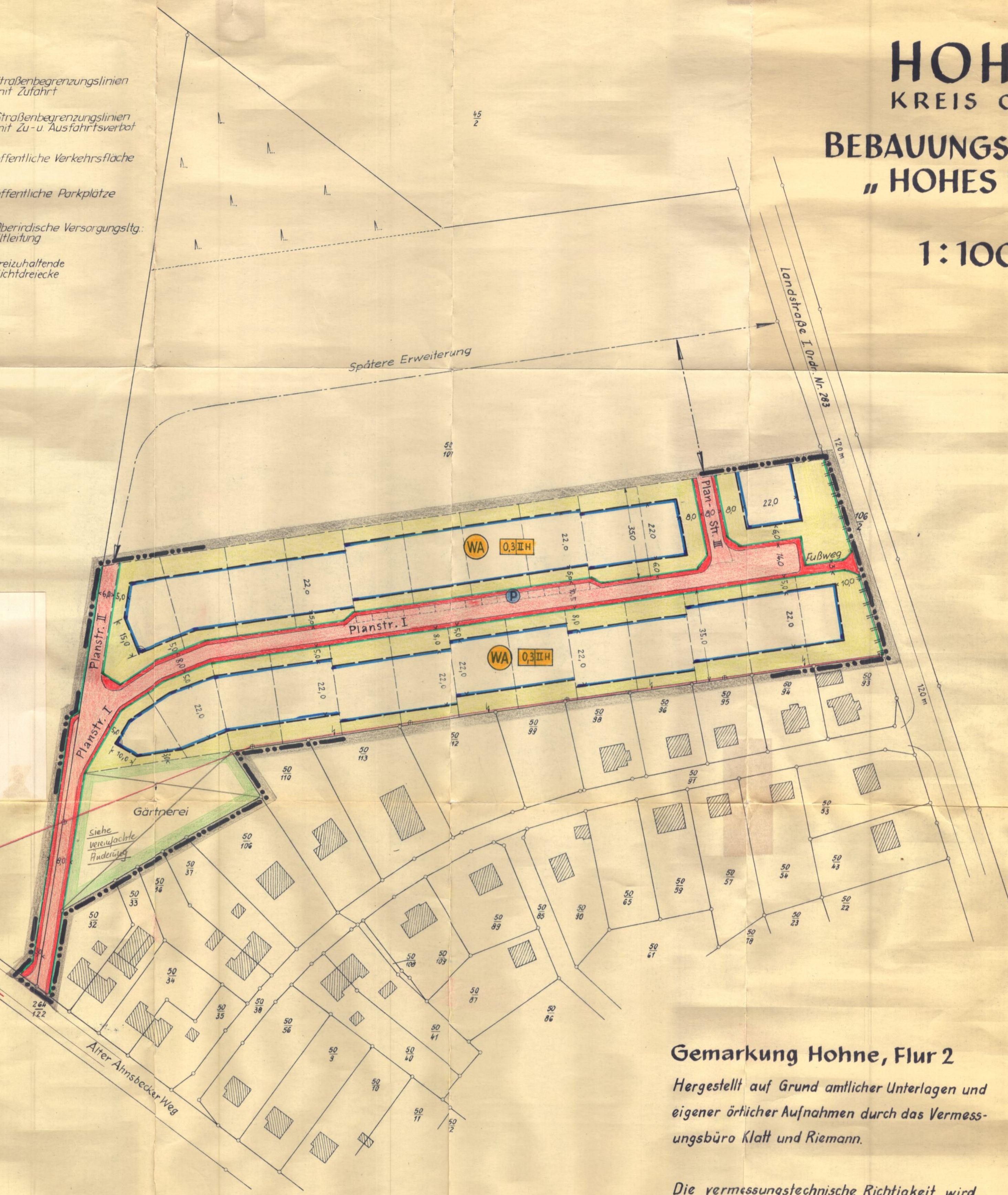
Lage des Geländes Maßst. 1:25000

Besondere Festsetzungen Der Ausbau des Dachgeschosses kann als Ausnahme gem. § 31 (1) BBAUG in Gebieten, für die als Geschoszahl I festgesetzt ist, auch dann zugelassen werden, wenn das Dachgesch. gem. § 7 C der Bauordnung 1962 für den Regierungsbezirk Lüneburg als Vollgesch. gilt.