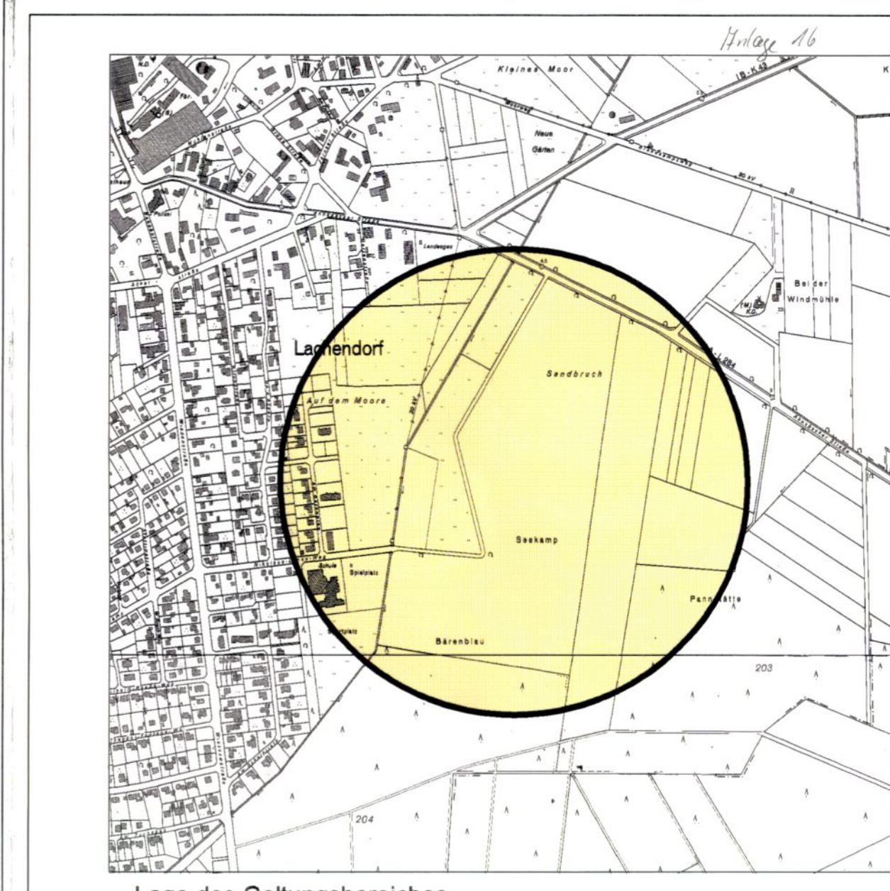
Lage des Geltungsbereiches Verkleinert: Auszug aus der Deutschen Grundkarte 1:5.000 (DGK G) im Maßstab 1:10.000

GEMEINDE LACHENDORF OT Lachendorf - Landkreis Celle