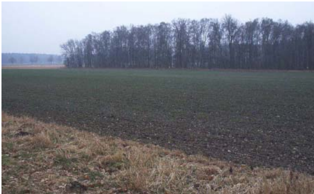
Die Maßnahmenfläche im Flurstück 205/1 (aufgenommen Anfang Februar 2009).

Die Pflanzung wird in Abstimmung mit der unteren Waldbehörde des Landkreises Celle unter Verwendung von forstlichem Vermehrungsgut gemäß Forstvermehrungsgutgesetz durchgeführt.